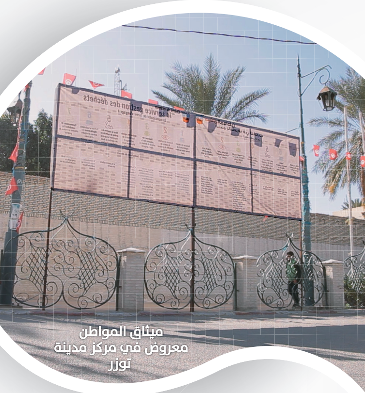
ميثاق المواطن معروض في مركز مدينة توزر

وقد حفز نجاح هذه المشاريع النموذجية عدة مؤسسات عمومية للقيام بمبادرات مماثلة مثل مستشفى شارل نيكول بتونس ، المستشفى الجهوي بتطاوين و المحكمة الإدارية بسيدي بوزيد الذين بادروا بصياغة ميثاق المواطن الخاص بهم .